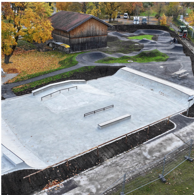
Eröffnung Skate- und Pumptrackanlage Oberammergau