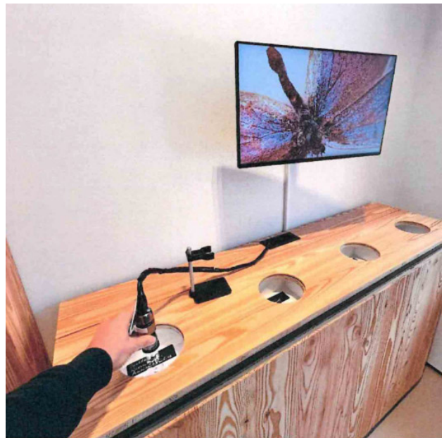
Mit Murrelbahn und Handmikroskop durch die Landschaft