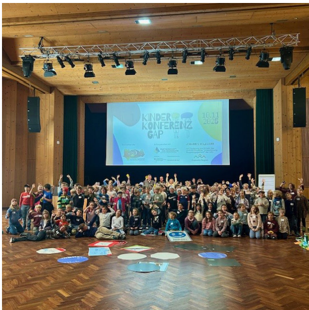
Kinderkonferenz 2025 – Demokratie erlebbar machen